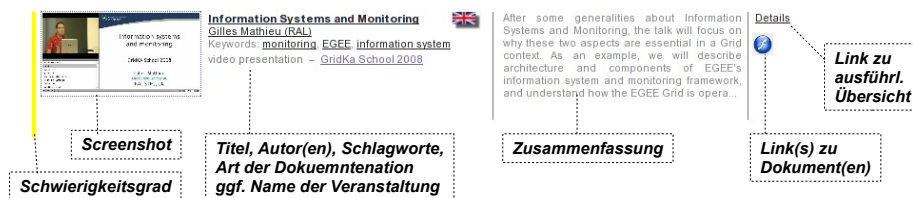
Abbildung 2: Kurzdarstellung von Inhalten

Hinter den ‚Zielgruppenschnittstelle‘ verbergen sich im Falle von SuGI ein Typo3-Content-Management-System und eine relationale Wissens- bzw. Inheldatenbank, die, als Open Source-Produkte realisiert, eine hohe Flexibilität aufweisen. Über das Web-Frontend wird den Zielgruppen nicht nur ein Zugang zu intern und extern produzierten Lerninhalten etc. geboten, vielmehr besteht darüber hinaus die Möglichkeit, Aufzeichnungen von Inhalten bzw. Inhalte von Präsenzs Schulungen zu archivieren und wiederholt abrufbar zu machen, eigene, selbst produzierte Inhalte einem größeren Publikum zur Verfügung zu stellen sowie einige Grid-Communities exemplarisch ausführlich vorzustellen und deren Arbeitsweise anschaulich zu beschreiben, um so das D-Grid-Portal entsprechend zu ergänzen und den Nutzern tiefere Einblicke in die angewandte Arbeit mit dem Grid zu ermöglichen.